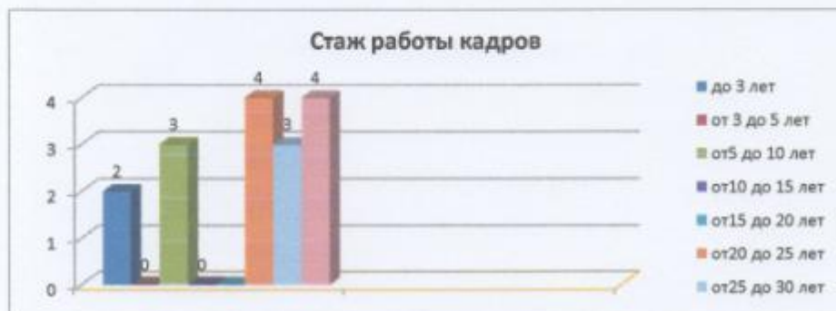
Диаграмма с характеристиками кадрового состава детского сада

МКДОУ д/с № 12 с. Арзгир укомплектован педагогами на 100 процентов согласно штатному расписанию. Всего работают 34 человека. Педагогический коллектив детского сада насчитывает 14 специалистов. За 2018 год педагогические работники прошли аттестацию и получили: – высшую квалификационную категорию – 8 педагогов; – первую квалификационную категорию – 3 педагога; - без категории – 3 педагога (в связи с переводом на другую должность). Курсы повышения квалификации в 2018 году прошли 11 работников МКДОУ д/с № 12 с. Арзгир, из них 10 педагогов и 1 младший воспитатель.